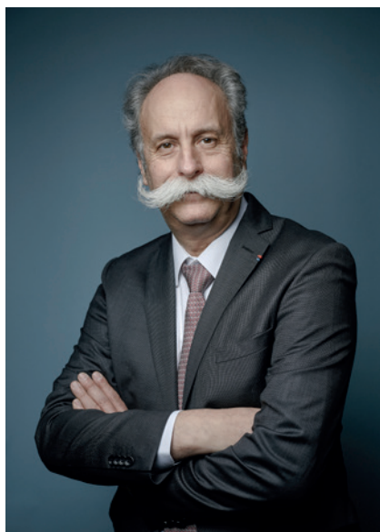
Bernard STALTER Président de l'Assemblée Permanente des chambres de métiers et de l'artisanat

Motion adoptée par l'Assemblée générale des chambres de métiers et de l'artisanat le 1 er février 2017